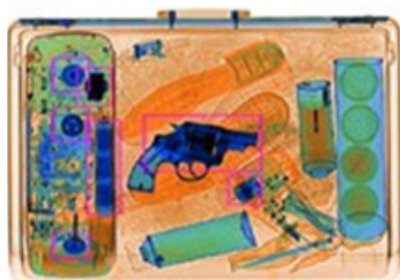
Изображение HI-MAT PLUS с результатами работы функции HDA

Рамкой отмечаются только объекты определенного размера и уровня поглощения излучения. Оператор может регулировать минимальное значение размера и поглощения для выделения объектов рамкой. Дополнительно, можно включить звуковую сигнализацию, тогда конвейерная лента автоматически остановится при обнаружении объекта, отвечающего установленным критериям.